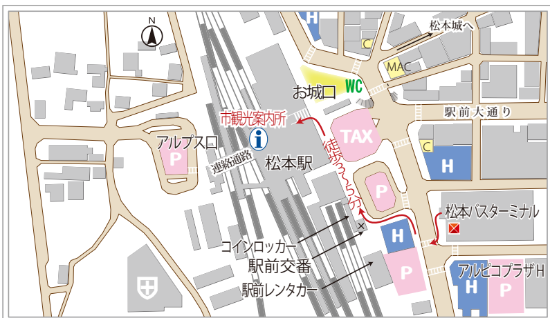
松本バスターミナル案内図