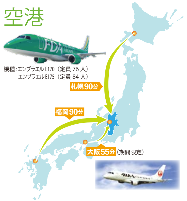
まつもとと空港案内図

(問)フジドリームエアラインズ 0570-55-0489 信州まつもと空港 0263-57-8818