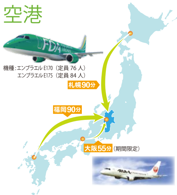
まつもとと空港案内図

(問)フジドリームエアラインズ 0570-55-0489 信州まつもとと空港 0263-57-8818